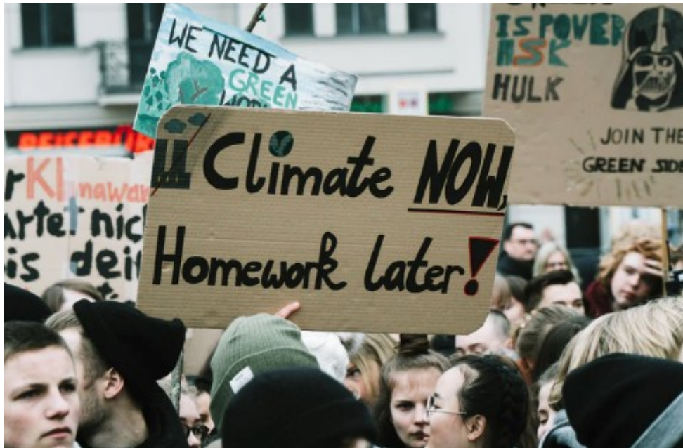
6: photo de Jonathan Kemper